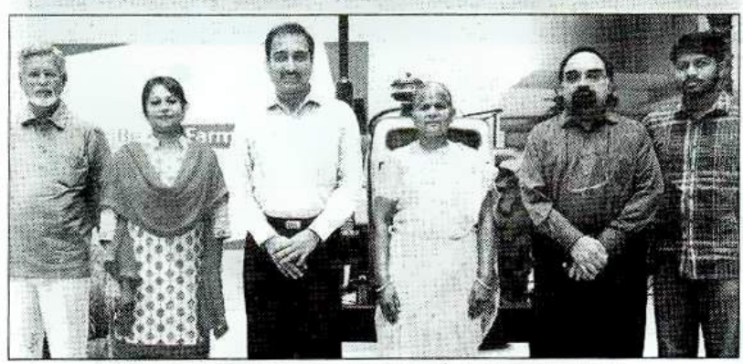
రైతు మిత్రులు కండి ప్రచార కార్యక్రమంలో పాల్గొన్మ నిర్వాహకులు

కోడంబాక్కం: దేశంలోని రెండో అతిపెద్ద ట్రాక్టర్ తయారీ సంస్థగా పేరుగాంచిన ట్రాక్టర్లు, వ్యవస్థా పరికరాల సంస్థ టెఫె రెతుల కోసం సరికొత్త సమార కార్యకమాన్స్