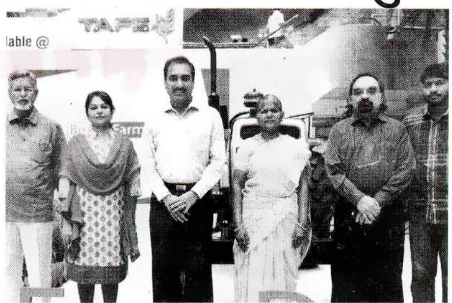
कृषि के प्रति उत्साही और फूल टाइम किसान समेत टैफे कंपनी के अधिकारी साथ में।